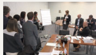
海外でのリスクマネージャー研修の様子