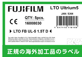
正規の海外加工品のラベル

押収した5本梱包箱や20本輸送箱のテープやラベルは当社が出荷時に使用しているものとは異なりました。しかし、出荷後に再梱包される場合があるため、偽装品と断定することは出来ません。