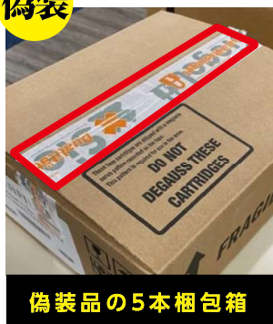
偽装品の5本梱包箱