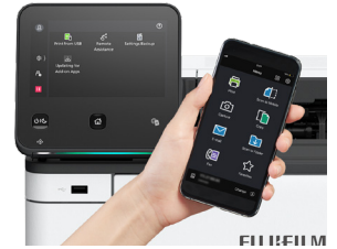
Impression depuis des appareils mobiles