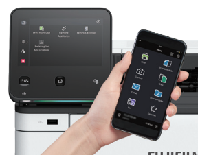
Stampa da dispositivi mobili