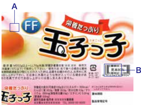
A グラデーション網