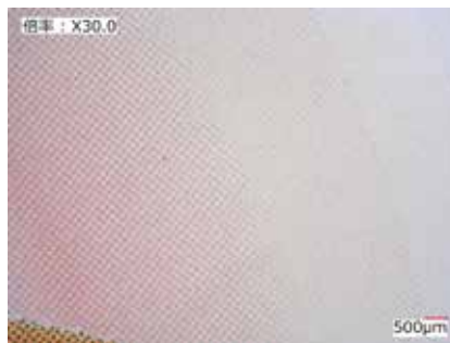
B 凸文字/バーコード