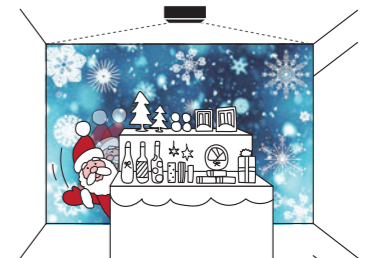
状況に合わせたシーンづくり