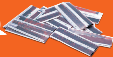
写真 フィルム を DVD