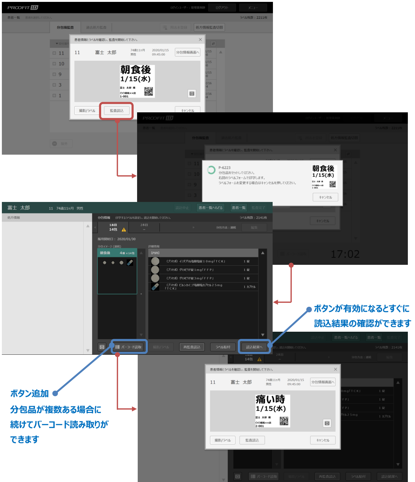
図4. 分包機監査ダイアログからの画面遷移

分包品が複数ある場合に、続けて次の分包品のバーコードを読取り、監査が可能になりました。図4の「バーコード読取」から実行できます。