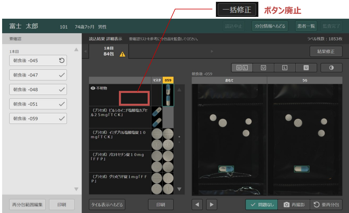
図1. 単一包画面の一括修正

単一包画面で「一括修正」を行った場合、修正対象となる全ての包画像を確認しないまま他の包まで意図せず修正してしまうことがありました。誤操作防止のため、単一包画面の「一括修正」ボタンを廃止しました。(図1)