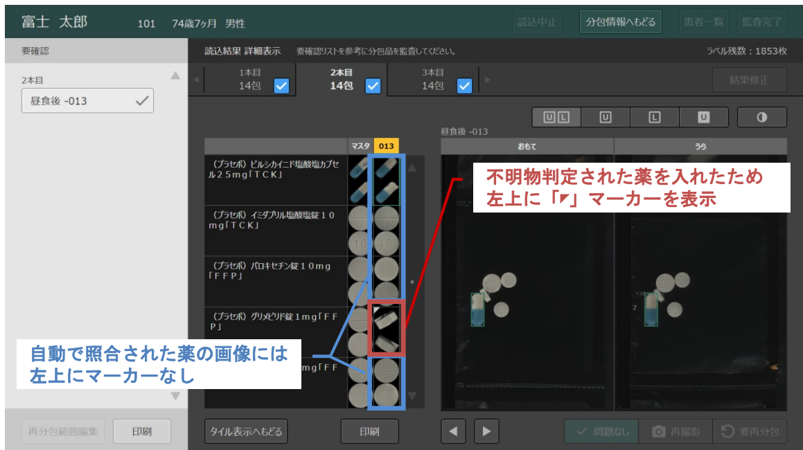
図3. 照合結果の修正

照合結果を修正した薬剤画像の左上に「ㄟ」マーカを表示する機能を追加しました。監査記録を後日見直した際に、修正箇所が一目で判断できます。