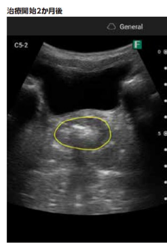
大きな便秘栓が消失し直腸の全周が観察できる

小児診療において、エコー検査は心臓や腹部、穿刺補助など幅広く活用されていますが、従来の据置型装置では診察の流れが分断され、子どもや保護者に負担を与える場面も少なくありません。ポータブルエコーを診察室で導入することで、子どもの心理的負担を軽減し、親子との信頼関係を深める新しい診療スタイルをはじめませんか？