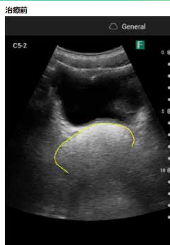
高エコーに観察される直腸の便秘栓