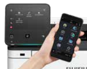
Drukowanie z urządzeń mobilnych